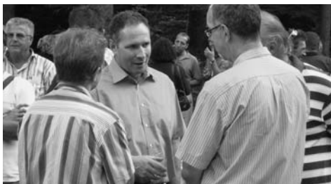
Angeregte Diskussionen beim Apéro.