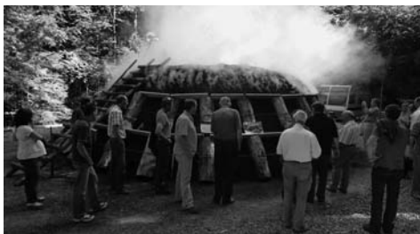
Der Kohlenmeiler Biezwil. Zentrum der Festaktivitäten des WWV Bucheggberg.