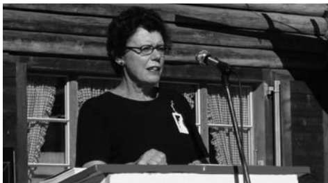
Regierungsrätin Esther Gassler.