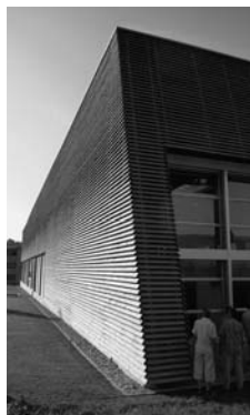
Bürogebäude Zaugg AG, Halle PRO-CAM CNC AG

blieb es im Inneren der Halle angenehm kühl. Dies ist ein Resultat der besseren Gebäudedämmung, eine der Voraussetzungen für diesen Standard. Die Beheizung / Kühlung erfolgt über eine Erdsonde. Zusätzlich ist auf der Halle eine Photovoltaikanlage mit gut 22 kWp Leistung vorgesehen. Der so zusätzlich produzierte Strom kann ins Netz eingespielen werden.