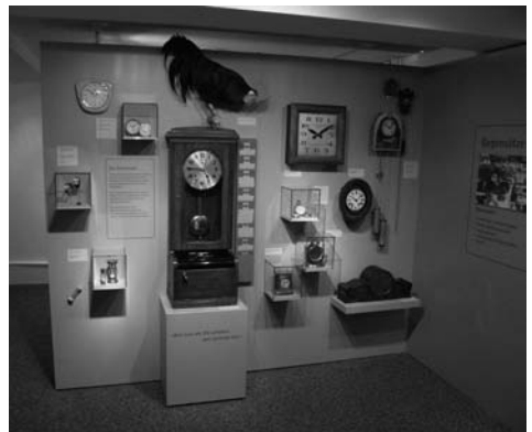
Kulturhistorisches Museum Grenchen

Im entfernten Sinn Kultur ist für uns auch der Skilift Grenchenberg, den wir stark unterstützen. Weiter beteiligen wir uns nach einem festen Verteilschlüssel zusammen mit der Einwohnergemeinde Grenchen an den Kosten für den Unterhalt der Infrastruktur auf dem Grenchenberg, hier vor allem die Bergstrasse. Nicht zuletzt leisten wir jährlich einen namhaften finanziellen Beitrag an die Kosten der Altersehrung der Einwohnergemeinde Grenchen.