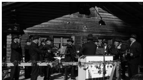
Musikalische Umrahmung.